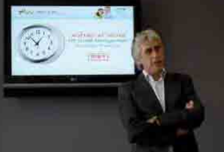
Het project Ageing at Work wou op basis van de informatie- en innovatie-uitwisseling tussen de partners een gepaste, praktische opleiding voor HR-professionals voorzien

zicht van de opbouw van de Belgische Ageing at Work-training. De opleiding was zodanig opgesteld dat de deelnemers via een aantal stappen werden meegeleid doorheen een traject, om uiteindelijk te komen tot een kleinschalige interventie-oefening - als een soort eerste stap "in de goede richting". De verschillende stappen waren achtereenvolgens: