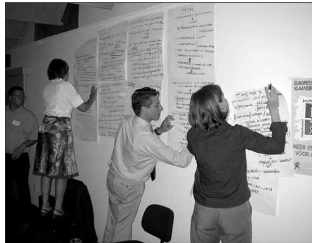
Het maken van een muurkrant.

volgende stap meer uitleg geeft en (2) een detailverslaggever (iemand van de werkgoesting-ploeg) om later de detailverslaggeving te vergemakkelijken.