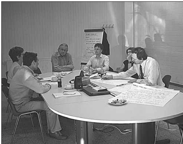
Werken in kleine groep.